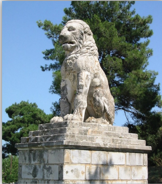
Der Löwe von Amphipolis